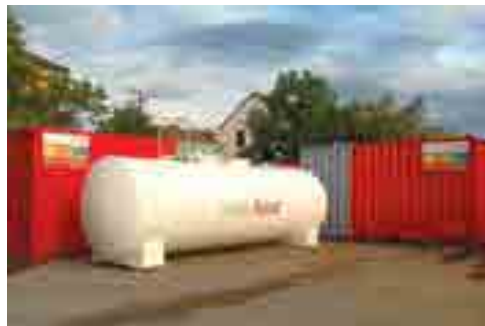
(Abb. Übergangswärmeversorgung des Stadtteils Zellerau in Würzburg mittels Heizcontainer)