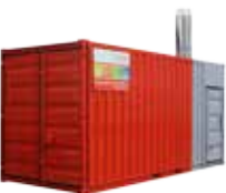
(Abb. 600 kW Heizcontainer)