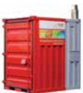
(Abb. 300 kW Heizcontainer)