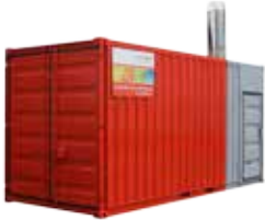
(Abb. 2.000 kW Heizcontainer)