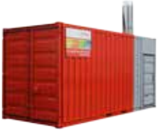
(Abb. 1.000 kW Heizcontainer)