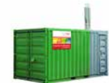
(Abb. 300 kW Pelletsheizcontainer)