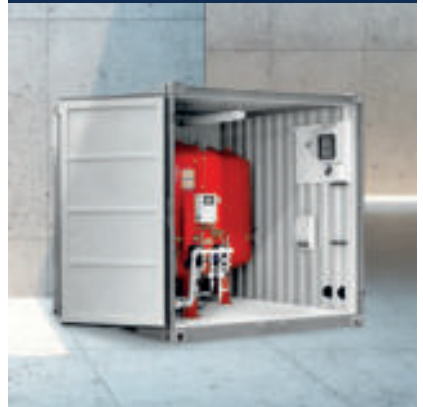
Druckhaltung- und Entgasung